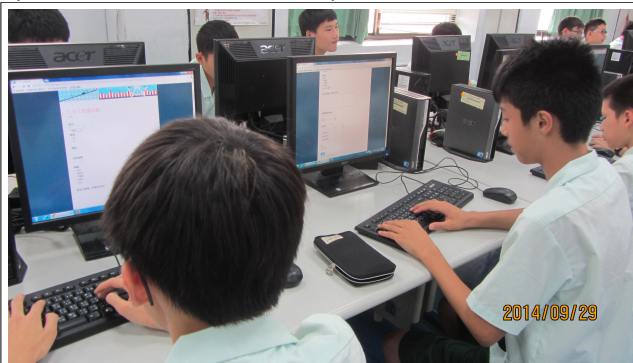
分享問卷給他人填寫

利用電腦課時，帶領學生利用 PC 從安裝 Google 表單到設計問卷至產出問卷，最後可把自己創作的表單網址分享給其他人，最後可以看到立即回應的內容，以及教導利用圖表來整理回應的內容，此堂課共花了三堂課完成，學生都收獲滿滿，對於設計表單覺得簡單易上手，學生認為 Google 表單很適合用在班務的處理上（例如通訊錄、繳交作業等）。